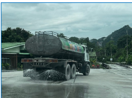
รถฉีดพรมน้ำในพื้นที่โครงการ