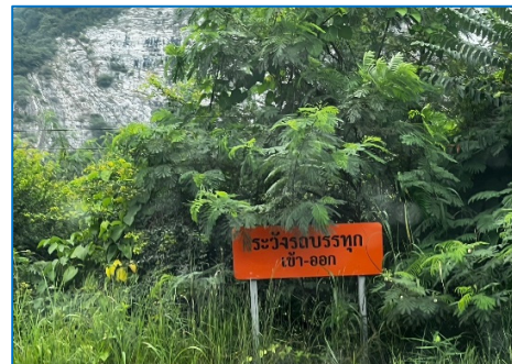
ป้ายเตือนระวางรถบรรทุกเข้า-ออก