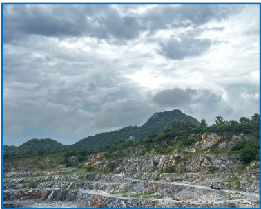
หน้าเหมืองปัจจุบัน