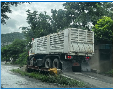
ตาชั่งน้ำหนักรถบรรทุก