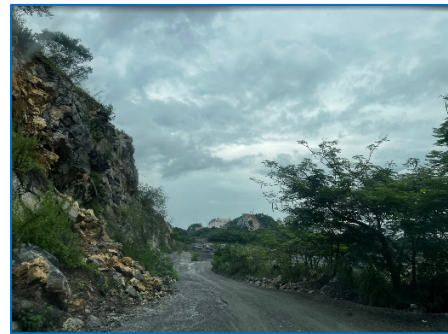
แนวเส้นทางทำเหมืองระยะ 10 ม.