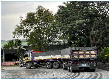
รถบรรทุกปิดคลุมผ้าใบ