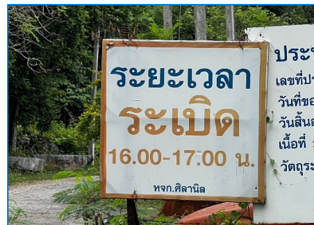
ป้ายแจ้งเตือนระยะเวลาการระเบิด